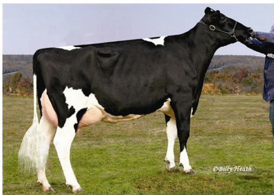
COOKIECUTTER GLD HOLLER FIFTH DAM